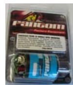
SCHUMACHER Fantom 19X1