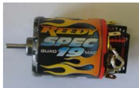
REEDY 19X1 Spec Quad