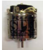
REEDY 19X1 Spec Class