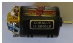
CORALLY Black 19X1