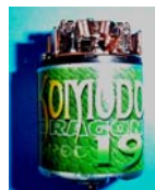
TRINITY Komodo Dragon